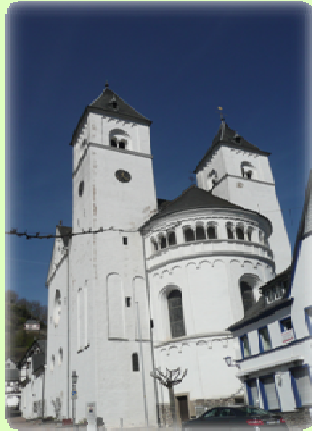
Stiftskirche St. Castor

Karden, am Unterlauf der Mosel, 40 km vor Koblenz gelegen, wird zu Recht als der kulturgeschichtlich bedeutsamste Ort zwischen Koblenz und Trier bezeichnet.