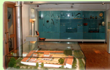
Keltisch-Römische Abteilung (Stiftsmuseum Treis-Karden)

Wandern Sie über den Moselsteig zur Tempelanlage! Über den Lenus-Mars Weg, Teilstück der Etappe von Cochem nach Treis-Karden, benötigen Sie ab Pommern 45 Minuten und ab Karden 1 Stunde.