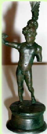
Figur des Lenus Mars

An der Stelle des heutigen Ortes befand sich das römische Straßendorf Cardena. In einem großen Töpferbezirk fertigte man Weihegeschenke an, die die Gläubigen dem Gott als Opfer darbrachten.